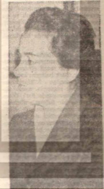
Saadet Evren Atatürkçüleri suçladı