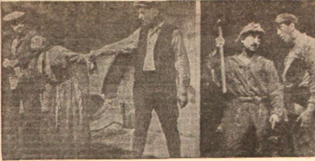
Cahit Atay'ın «Sultan Gelin» ile «Ormanda» sından birer sahne.