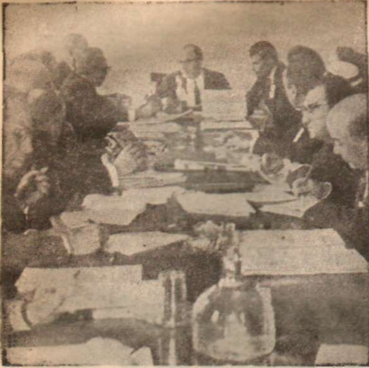
Sinema Şurası'ndan görünüş Filmcileri aramayınız