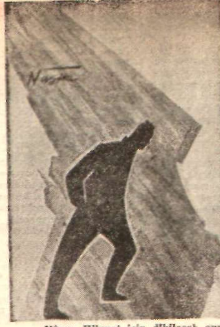
Nâzım Hikmet için dikilecek anıt

Bulgaristanda da Nâzım Hikmetin edebî külliyyatı Türkçe olarak basılacak. O da altı cilt olacak. Beni Bulgaristana da